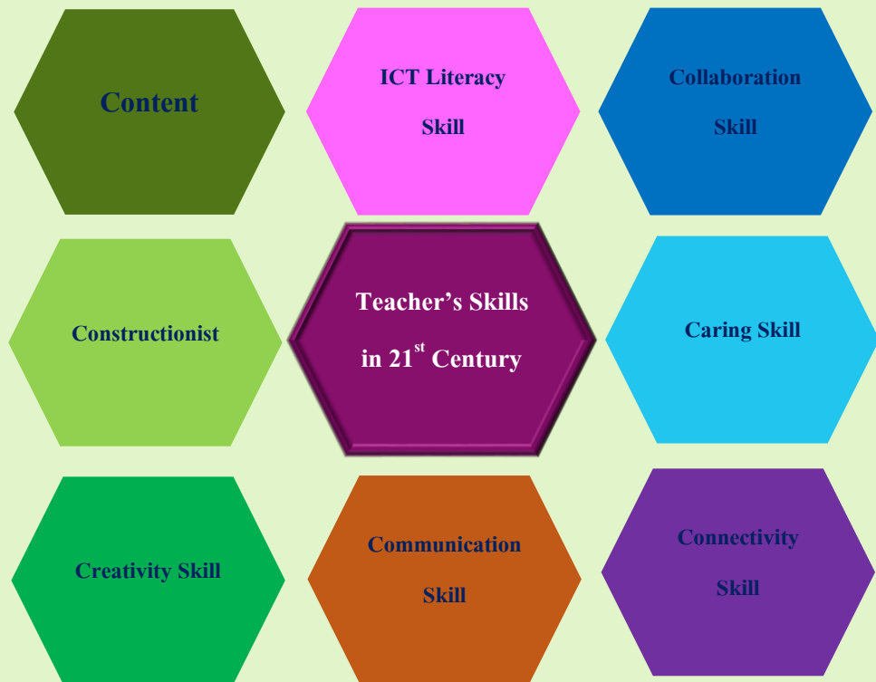
ภาพที่ 2 ทักษะครูในศตวรรษที่ 21

ทั้งนี้การที่ผู้สอนมีทักษะต่าง ๆ เหล่านี้ได้องค์ประกอบสำคัญที่ผู้สอนควรมีในฐานะครูจำเป็นต้องมีคุณลักษณะดังต่อไปนี้จึงจะสามารถพัฒนาทักษะของตนเอง และผู้เรียนไปยังจุดมุ่งหมายที่ต้องการได้